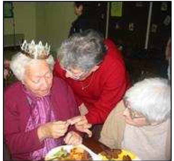
Accueil itinérant à Carolles - janvier 2009